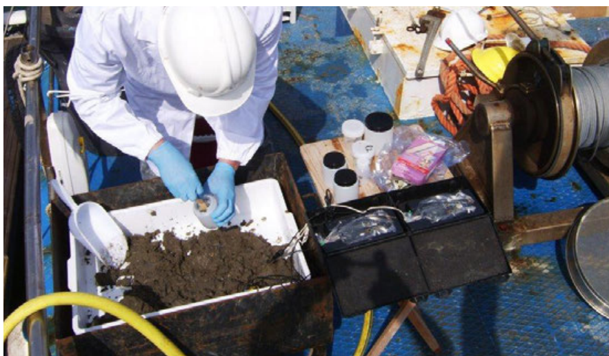
Fig- 3 - Attività di prelievo di sedimenti in ambito portuale. Esempificazione delle fasi di prelievo dei sedimenti durante una caratterizzazione ambientale.

essere facilmente regolate e identificate con certezza dal contesto normativo. Il monitoraggio dei parametri chimico-fisici del sedimento offre la possibilità di standardizzare metodi riproducibili e codificati da norme ISO (International Organization for Standardization) o da Enti nazionali di accreditamento (Accredia). I limiti di rilevanza possono essere definiti facilmente anche dalla normativa. Il risultato prodotto dalle attività di monitoraggio è un numero per ogni parametro analizzato ed