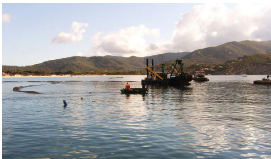
Fig-2 - Attività di dragaggio in ambito portuale. L'immagine rappresenta le classiche operazioni di dragaggio di sedimento portuale e le associate operazioni di ripascimento morbido dell'arenile limitrofo. Nel caso rappresentato, le operazioni sono condotte mediante l'uso di una draga aspirante-refluente. Si notano la condotta galleggiante per il trasporto del materiale aspirato verso il sito di deposito e le panne di contenimento del plume di torbidità sollevato dall'attività della draga. Le panne assorbenti sono posizionate a tutela degli habitat di pregio quale, ad esempio, la prateria di Posidonia oceanica che è molto sensibile all'impatto derivante dall'intorbidimento delle acque.

In Italia il dragaggio dei sedimenti portuali, con l'eccezione dei porti interni ai siti di bonifica d'interesse nazionale (SIN), è oggi autorizzato dopo preventiva valutazione del rischio derivante dalla movimentazione dei fondali. La valutazione include la caratterizzazione ecotossicologica, chimica, fisica e microbiologica dei materiali da dragare ai sensi del D.M. 173/16. L'evoluzione della norma italiana che disciplina questa materia si è realizzata seguendo un processo lungo oltre trent'anni. Le attività di caratterizzazione necessarie a ottenere il rilascio dell'autorizzazione alla movimentazione dei sedimenti sono state definite, per la prima volta in Italia, dal D.M. 24/01/96